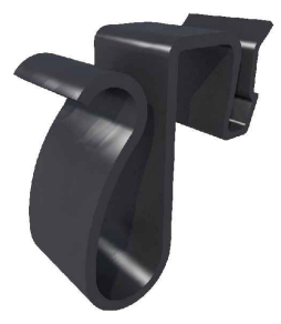
Geometría del producto